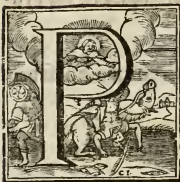
TABLA DE CEBES:

Orque es assi verdad, y có mucha razon lo dixo el Poëta Horacio, que siépre mueve mas floxamente los animos lo que el oydo les ofrece, que lo que có fidelidad los ojos les presentan: có mucho ingenio y aguda invencion bus, có el Philospho Cebes manera, como queriendo enseñar todo lo que pertenece para la buena institucion de la vida de los hombres, no solamente se enseñasse, para que oyendolo lo entendiessen, sino que tambien quasi